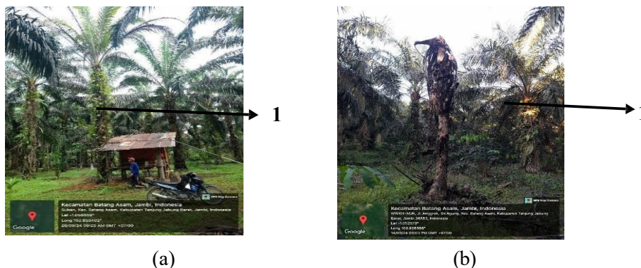
Gambar 1. Tanaman Kelapa Sawit Terserang Jamur Ganoderma sp. di Tanaman Kelapa sawit Asal Bibit Unggul Di Desa Suban.

Gejala serangan jamur Ganoderma sp. yang tampak di lapangan pada tanaman kelapa sawit asal bibit unggul seperti terlihat pada Gambar 1.