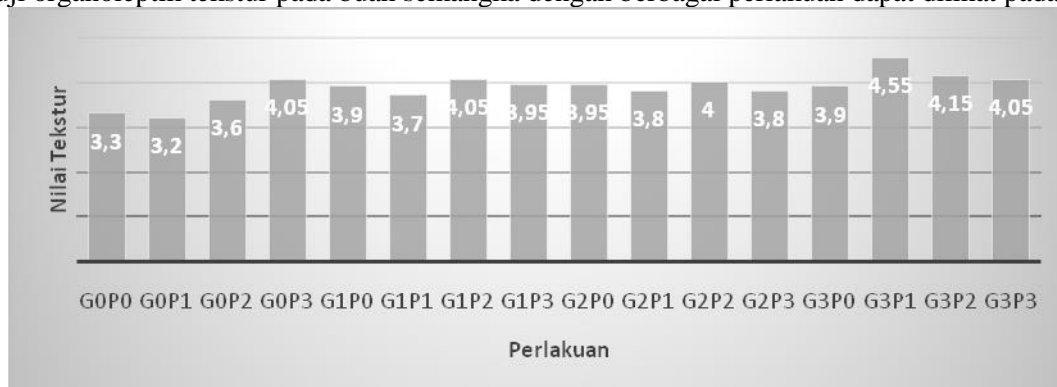
Gambar 2. Uji organoleptik terhadap tekstur buah semangka.

Hasil uji organoleptik tekstur pada buah semangka dengan berbagai perlakuan dapat dilihat pada Gambar 2.